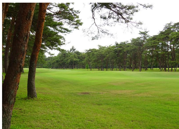
絶妙なアンジュレーションです

グリーン手前には大きな松の木とバンカーが待ち構えており、 2打目以降も全く気を抜くことが出来ないホールです。