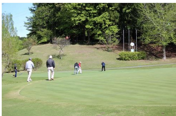
練習グリーンは他のゴルフ場の何倍？

もちろんゴルフ好きの皆さんは、 そんな練習環境があるなら練習しずにはいられない、 といったご様子でみっちり朝から汗を流されていました。