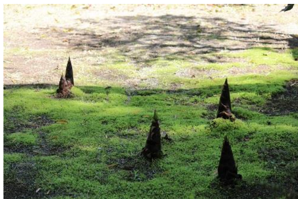
クラブハウスの前に筍が生えていました