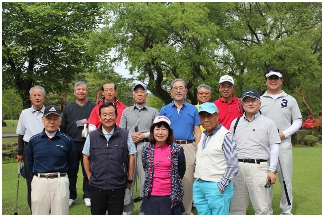
朝から皆さんと集合写真

ロペ倶楽部からそのままご参加の方と 日光CCからご参加の方と合流して多くの皆さんにご参加頂きました。