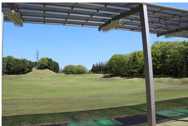
縦にも横にも広いドライビングレンジ

もちろん充実した設備も魅力の一つですので、 ドライビングレンジと練習グリーンも他のゴルフ場とは一味違いました！