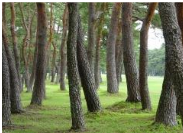
隙間がないほどの松がありました…