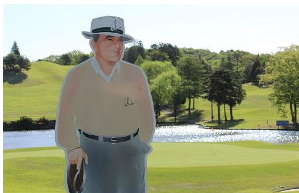
コースのあらゆるところで「ジーン・サラゼン」と記念撮影ができましたよ