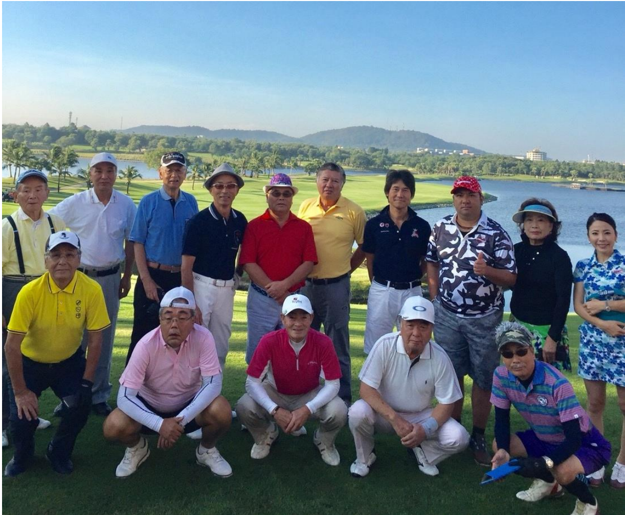
アマタスプリングゴルフクラブ

という方もいらっしゃいました。有名なホールは17番ホールの浮島がグリーンになっているホールで、ティーショットのあと船に乗ってこの浮島に移動をするという、とても素敵なホールです。皆さん写真撮影をしたり、素晴らしい景色に魅了されていました。