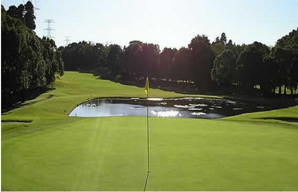
平川カントリークラブ 4番ホール

今回、皆さんからのお声の中でもコースの印象として多かったのが距離がたっぷりあることとグリーンの傾斜や速さについてでしたがそれを一番物語っているホールは4番のロングホールだそうです。戦略的にもグリーン手前の池の配置が効いていて、しかも、グリーンは3段グリーンですので絶妙な距離感が要求されます。