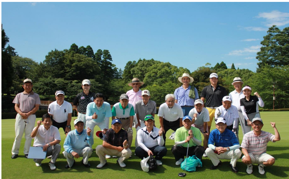
平川カントリークラブコンペ 集合写真

集合時間を迎え、競技ルール、スタート時間の確認も済ませたところで全員での記念写真を撮影しました。