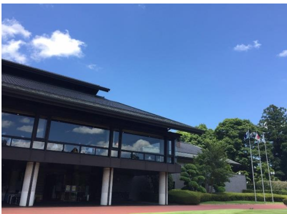
平川カントリークラブ クラブハウス

林間でレイアウトされた距離たっぷりのコースで、グリーンの速さでも評判ですがまずは豪華で綺麗なクラブハウスの雰囲気には驚かされました。